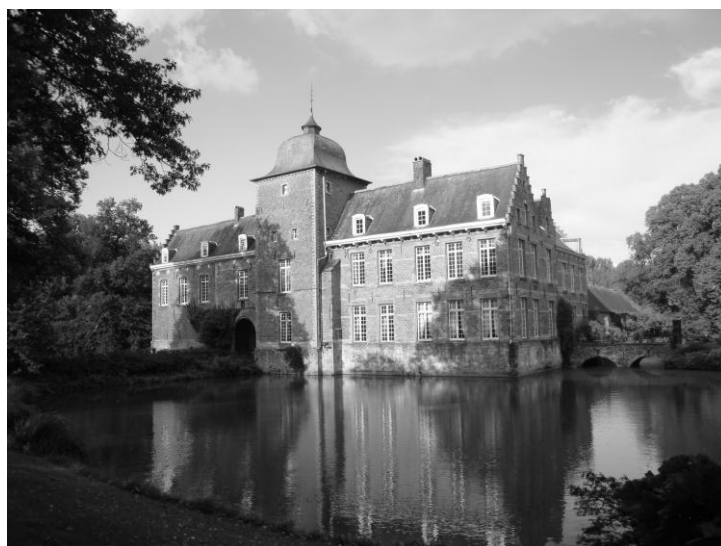
Domaine du Nieuwermolen à St-Ulriks-Kapelle

Editeur responsable : Guy Pardon Kalenbergstraat, 30, 1700 Dilbeek.